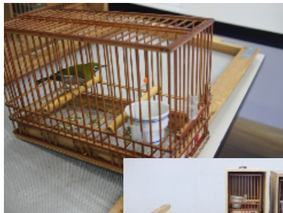
警察に押収されたメジロ