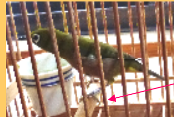
飼養登録を受けたメジロ